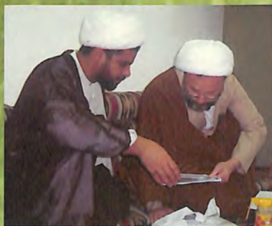
مع سماحة الشيخ محسن نجل المرجع الشيخ الوهيد الخراساني