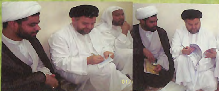
مع سماحة السيد جواد الشهرستاني في بعثة المرجع السيد علي السيستاني