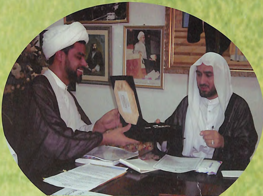
مدير مؤسسة فكر الأوحى في أحد لقاءاته بالحكيم الإلهي (دام ظله)