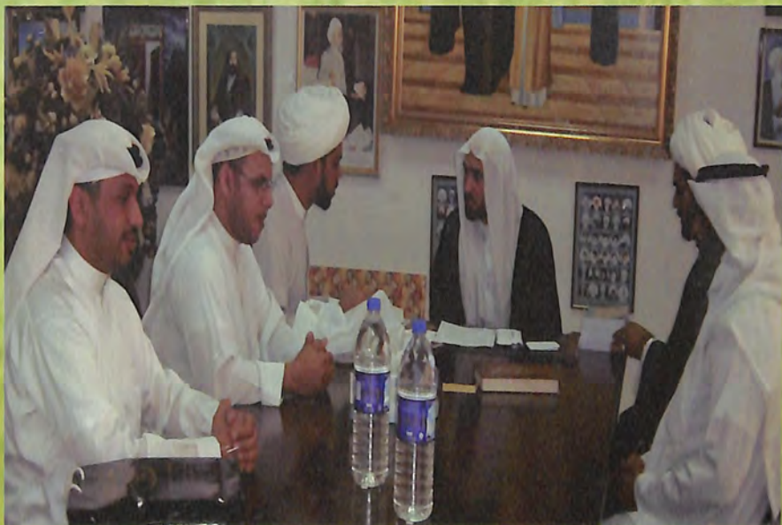
بعض أعضاء المجلس الإشرافي في المؤسسة في أحد اللقاءات مع الحكيم الإلهي