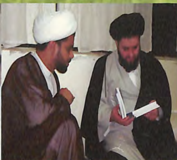
مع سماحة السيد حسين نجل المرجع السيد صادق الشيرازي