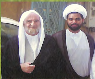
مع سماحة العلامة الشيخ علي الكوراني العاملي